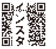
工芸フェア公式インスタ