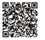
コザガールズ公式インスタ